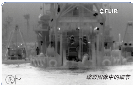
缩放图像中的细节